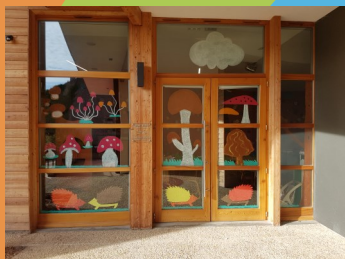
Périscolaire à Dombrot-le-Sec